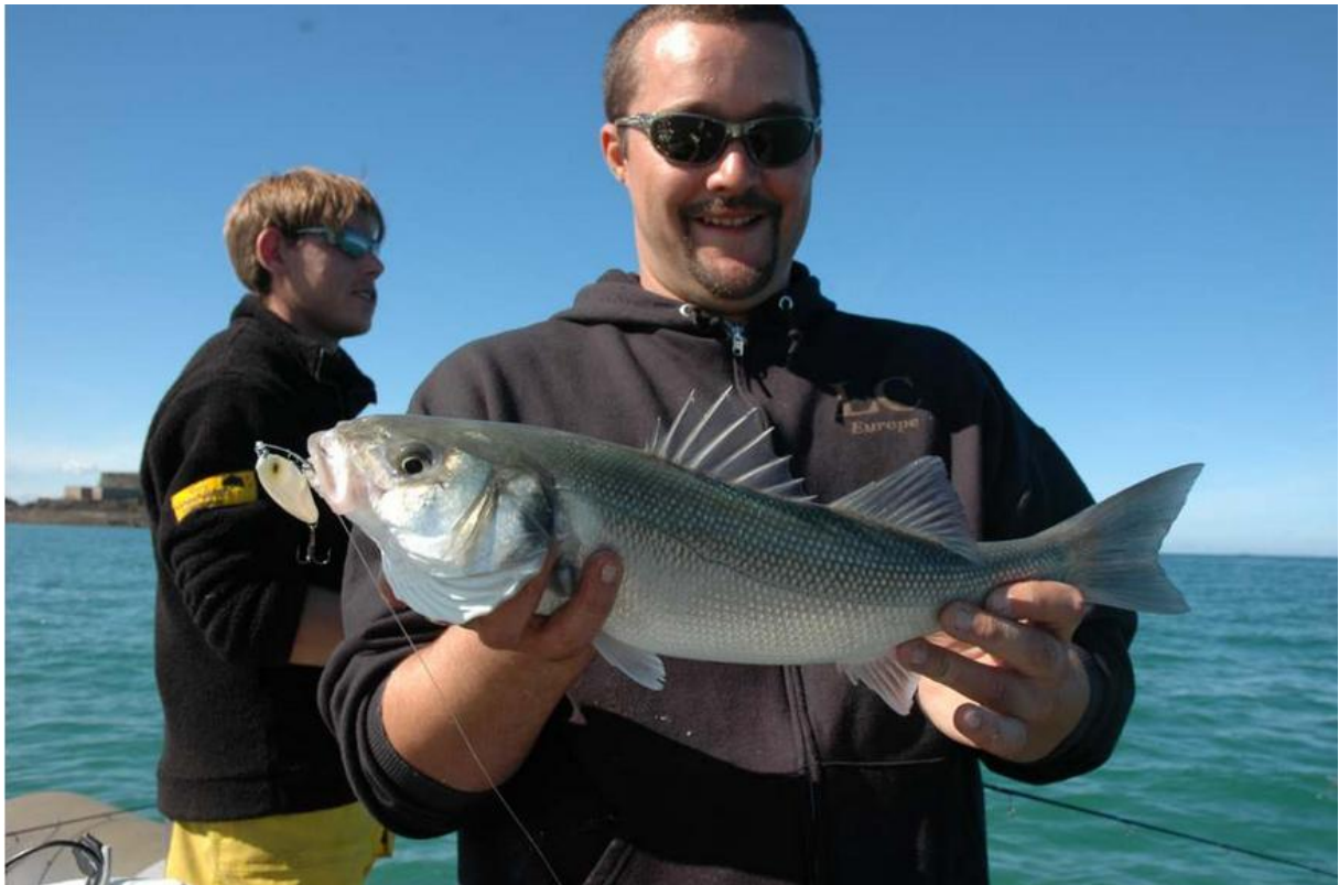
Le Big Foot est un leurre à avoir dans sa boîte

N'oublions les modèles plus gros, notamment deux leurres à avoir absolument dans sa boîte : Le Big Foot et le Mister Joe, tous deux des leurres Orion. Ces leurres sont parfaits pour prospecter.