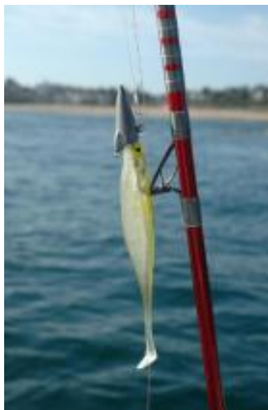
Un bon leurre souple pour le lancer-ramener