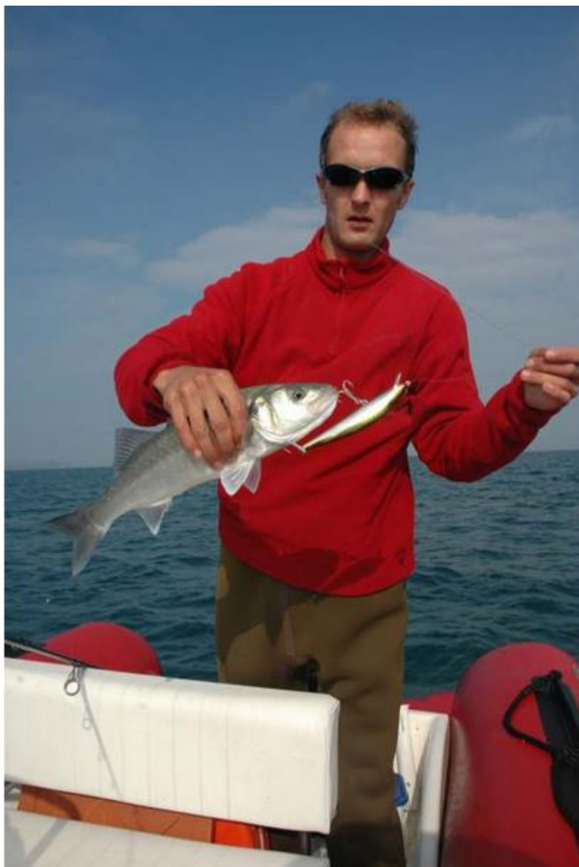
Ce poisson nageur K-Ten est extrêmement solide

La plupart des poissons nageurs du marché sont capables de provoquer l'attaque d'un bar. Il faut donc considérer un autre aspect : la solidité.