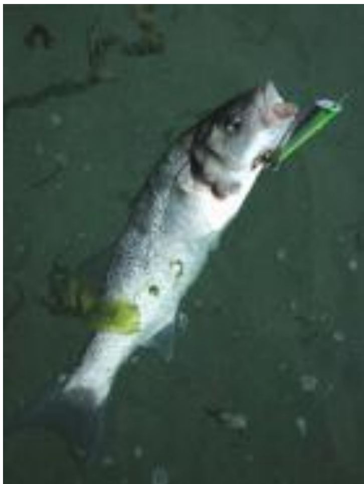
Ce leurre de surface K-Ten répond très bien à l'animation

Pour les poppers, la marque Orion est souvent conseillée. Pour les stickbaits, vous pouvez également choisir le Slider dans la gamme Orion. Mais d'autres stickbaits de surface ont déjà fait leur preuve. On notera ainsi le Spook, le Gunnish, l'Asturie, et les modèles K-Ten.