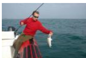
Un bar pris au-dessus des bouchots

Il s'agit d'explorer successivement tous les postes pouvant abriter des bars. Voici une liste non exhaustive : les rochers qui affleurent, les goulots entre les îles et rochers, les cassures dans le relief du fond, les bancs de sables, les parcs à huîtres, les bouchots, les estuaires.