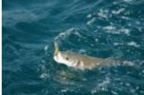
Un bar pris en bateau, au lancer-ramener

Il existe une multitude de leurres conçus pour le lancer ramener. Ils sont en général plus allongés que les leurres souples destinés à la verticale. Ces formes répondent bien aux animations du pêcheur. Ne vous posez pas trop de question lors du choix du leurre. La plupart fonctionnent très bien. C'est surtout le choix du poste et l'animation qui provoqueront la touche.