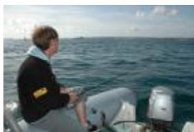
L'animation du leurre est précise, près du fond

La pêche à la verticale ne se pratique qu'en bateau. Il s'agit d'explorer le relief du fond en présentant un leurre souple, tout en laissant dériver l'embarcation. Les mouvements du leurre sont précis et d'amplitude mesurée. La dérive doit être lente, les jours de vent ne sont pas appropriés pour cette technique.