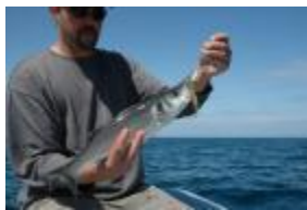
Ce bar n'a pas résisté à l'animation du leurre

L'action de pêche consiste à lancer son leurre contre les rochers affleurant, puis à lui faire longer la pente rocheuse. En conséquence, il est beaucoup plus facile de pêcher en bateau que depuis le bord . Les accrocs sont beaucoup plus nombreux en pêchant du bord, car le leurre doit remonter la pente rocheuse.