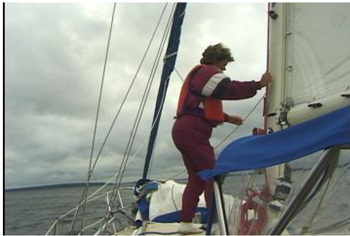
L'équipier se prépare à hisser la voile