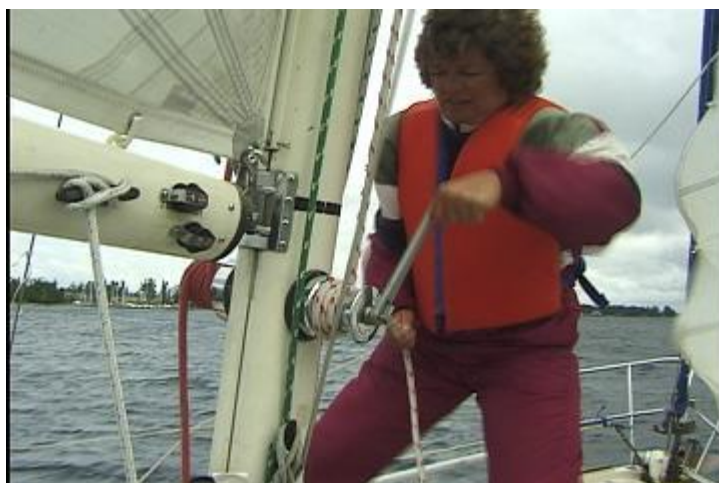
Le winch est de mise