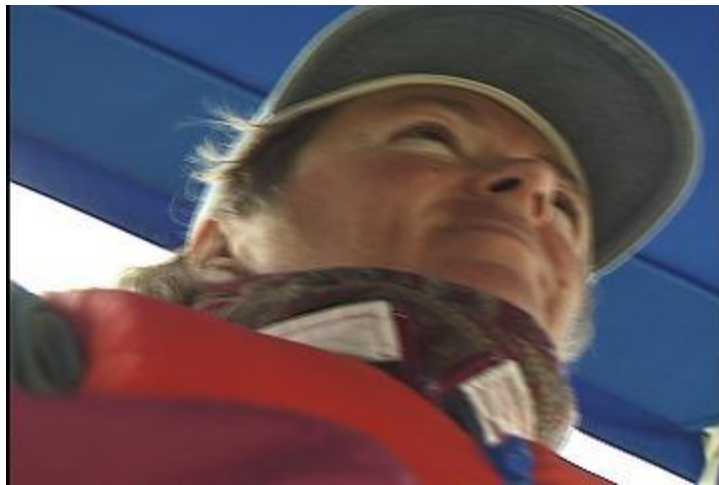
Le barreur évalue la force du vent

L'étai largable et le foc de route, belle solution par gros temps, Surtout quand le voilier est au près et qu'il faut louvoyer. Le foc de route est plus plat que le génois enroulé, donc plus performant et plus facile à manier au virement de bord.