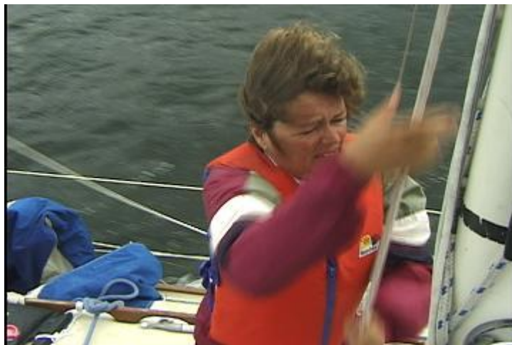
Il faut travailler vite