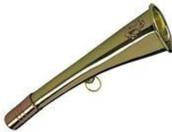
Corne de brume à la portée de la main