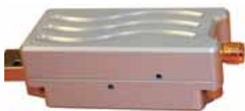
L'antenne 5MileWiFi et son amplificateur.

placée à l'extérieur pendant la transmission. L'alimentation se fait par l'intermédiaire d'un câble Ethernet de 25 pieds et il est inutile d'installer un logiciel pour faire fonctionner le système. Le fabricant annonce des portées mirobolantes pouvant aller jusqu'à 5 milles.