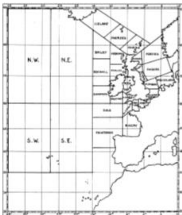
1 – Carte des zones anglaises utilisée à partir du 1 er novembre 1948, publiée dans Bulletin d'études et d'information de météorologie maritime , n° 3, juin 1951.